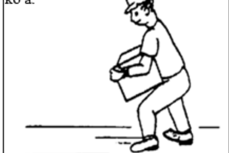
Figi 4. Kenbe chay la toupre kò a.