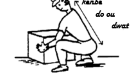
Figi 7. Eseye gen yon baz solid avèk pye ou epi kenbe chay la djanm.