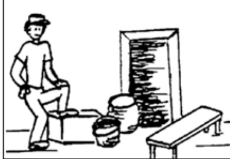
Figi 2. Tcheke wout la.