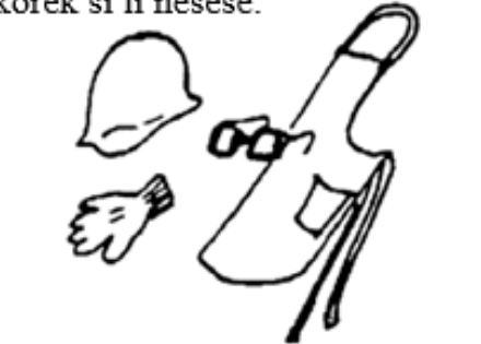
Figi 3. Mete rad pwoteksyon kòrèk si li nesèsè.