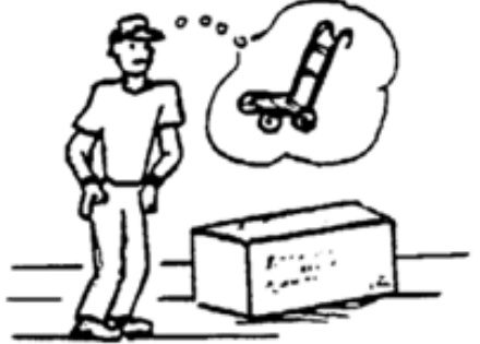
Figi 1. Evalue chay la.