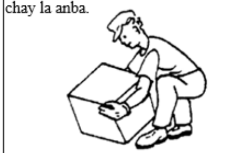
Figi 6. Pliye jenou ou pou mete chay la anba.