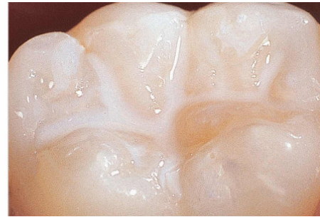
Dan ki gen Mastik

Kisa mastik pou dan yo ye? Mastik pou dan yo se yon ti kouch plastik tou mens yo mete nan fant ki gen sou sifas dan kote ou moulen an sou dan dèyè yo k ap pwoteje dan yo kont kari. Majorite kari dantè timoun ak adolesan yo genyen se sou sifas sa ke yo parèt. Mastik yo pwoteje sifas pou moulen an kont kari dantè yo poutèt li anpeche jèm ak kras manje yo rete kole nan fant yo.