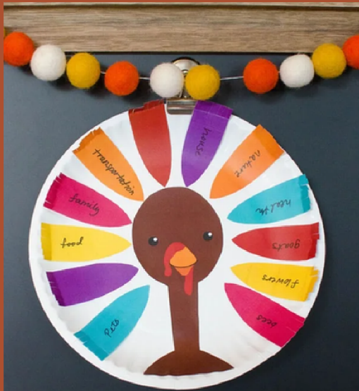
THANKFUL TURKEY easy kids craft